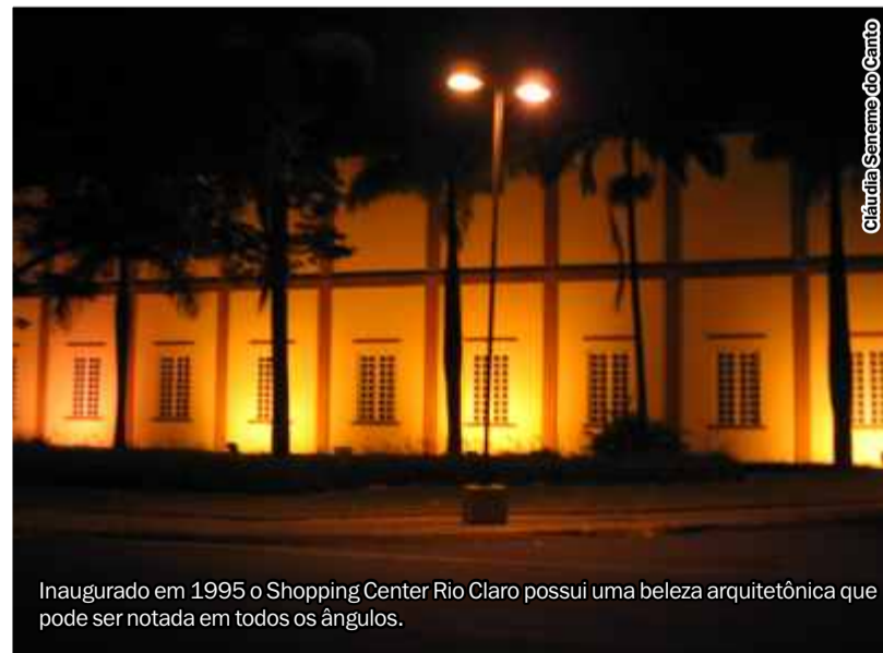
Inaugurado em 1995 o Shopping Center Rio Claro possui uma beleza arquitetônica que pode ser notada em todos os ângulos.