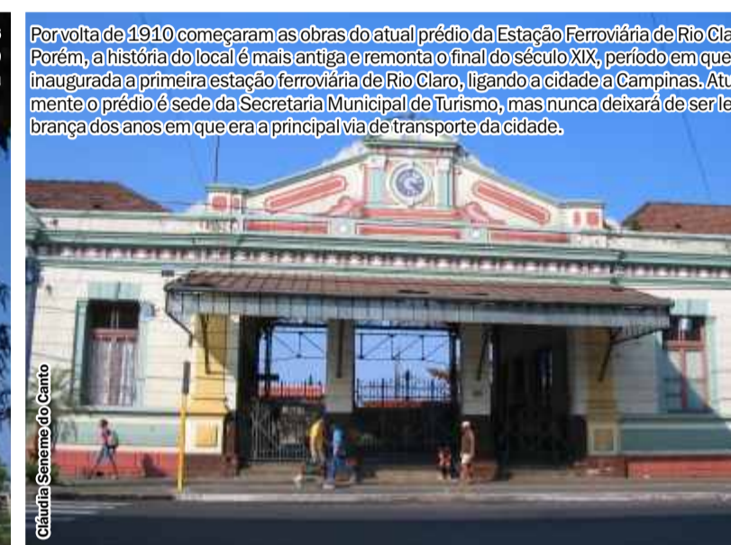
Por volta de 1910 começaram as obras do atual prédio da Estação Ferroviária de Rio Claro. Porém, a história do local é mais antiga e remonta o final do século XIX, período em que foi inaugurada a primeira estação ferroviária de Rio Claro, ligando a cidade a Campinas. Atualmente o prédio é sede da Secretaria Municipal de Turismo, mas nunca deixará de ser lembrança dos anos em que era a principal via de transporte da cidade.