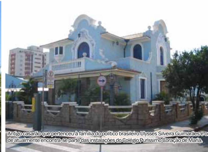
Antigo casarão que pertenceu à família do político brasileiro Ulysses Silveira Guimarães e onde atualmente encontra-se parte das instalações do Colégio Puríssimo Coração de Maria.