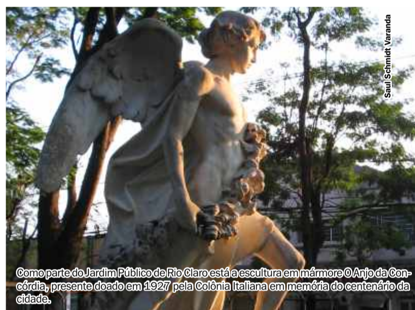
Como parte do Jardim Público de Rio Claro está a escultura em mármore O Anjo da Condição, presente doado em 1927 pela Colônia Italiana em memória do centenário da cidade.