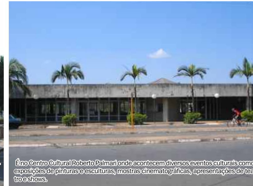
É no Centro Cultural Roberto Palmari onde acontecem diversos eventos culturais como exposições de pinturas e esculturas, mostras cinematográficas, apresentações de teatro e shows.