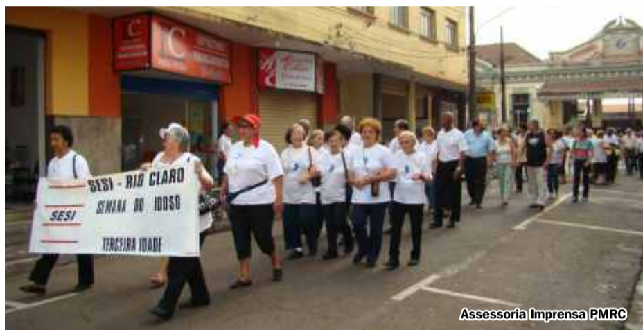
Assessoria Imprensa PMRC

Estão cansados de cuidar dos outros e de servir de exemplo: agora chegou a vez de eles serem