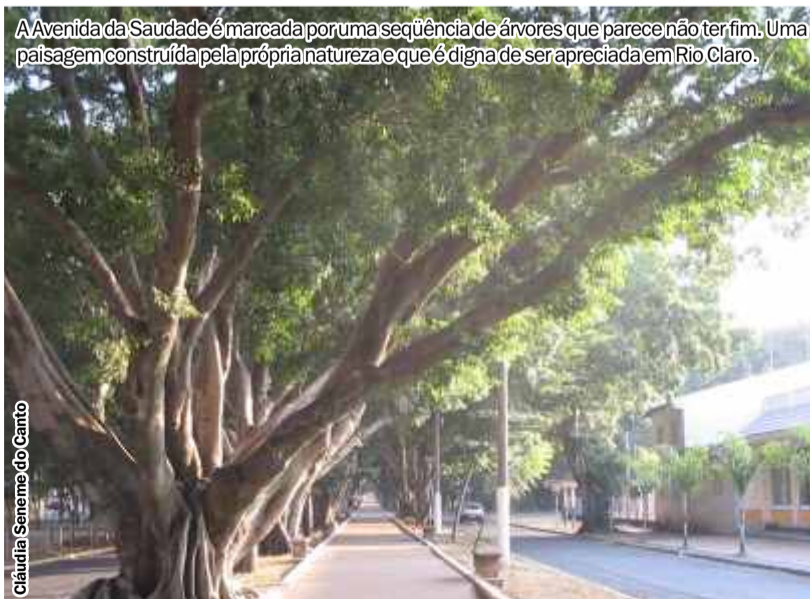
A Avenida da Saudade é marcada por uma sequência de árvores que parece não ter fim. Uma paisagem construída pela própria natureza e que é digna de ser apreciada em Rio Claro.