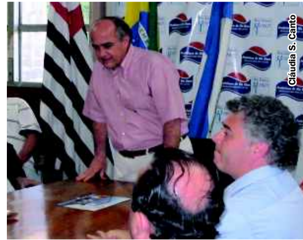
Prefeito discursa sobre as oportunidades criadas pelo Condomínio Industrial Cidade Azul

Destacou alguns outros projetos que gostaria de ver concretizado e que fazem parte do "Rio Claro Competitiva", como a construção de um aeroporto na área do Aeroclube, a criação de um centro tecnológico e a resolução dos problemas de lixo e