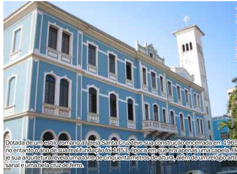
Dotada de um estilo romano a Igreja Santa Cruz teve sua construção encerrada em 1965, no entanto o ano de sua real fundação foi 1853, época em que era apenas uma capela. Hoje sua arquitetura revela uma torre de cinquenta metros de altura, além de um relógio artesanal e uma bela cruz de ferro.