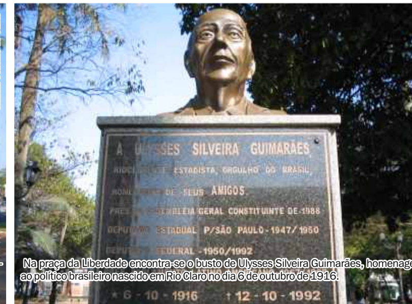
Na praça da Liberdade encontra-se o busto de Ulysses Silveira Guimarães, homenagem ao político brasileiro nascido em Rio Claro no dia 6 de outubro de 1916.

Envie sua sugestão para o e-mail setemaravilhas@jornalrioclaro.com.br. Se tiver fotos e história da maravilha que você sugerir, além da localização física da obra, será muito útil.