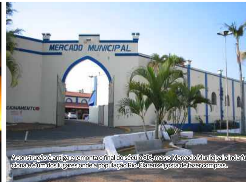
A construção é antiga e remonta o final do século XIX, mas o Mercado Municipal ainda funciona e é um dos lugares onde a população Rio-Clarense gosta de fazer compras.