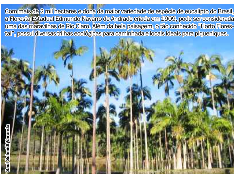
Com mais de 2 mil hectares e dona da maior variedade de espécie de eucalipto do Brasil, a Floresta Estadual Edmundo Navarro de Andrade criada em 1909, pode ser considerada uma das maravilhas de Rio Claro. Além da bela paisagem, o tão conhecido "Horto Florestal", possui diversas trilhas ecológicas para caminhada e locais ideais para piqueniques.

Como apreciar é uma qualidade humana que nem o tempo destrói, para fazer valer todas essas maravilhas e também para incentivar o zelo pelo nosso patrimônio, surgiu a idéia de eleger as Sete Maravilhas do Município de Rio Claro. A Empresa Jornalística R. Miranda esta finalizando o projeto que logo será apresentado a toda sociedade rio-clarense. O projeto prevê a escolha de um júri especializado e competente para selecionar as 30 mais importantes símbolos ou obras de nosso município que serão disponibilizadas para a votação popular. Porém, a partir desta edição haverá em todas as próximas um espaço dedicado a este tema, que contará histórias sobre obras, símbolos e paisagens dignas de serem admiradas em Rio Claro. Nesta fase inicial do projeto estaremos solicitando a colaboração de você, leitor, para nos ajudar a selecionar todas as obras que julgarem importantes, que serão levadas ao júri e escolhidas as 30 mais importantes. Assim, será criado um concurso cultural que prevê a votação popular entre essas trinta obras onde serão escolhidas as 7 Maravilhas de Rio Claro e, também, será selecionada uma frase sobre a preservação do nosso patrimônio histórico e cultural. A frase escolhida será contemplada com prêmios. Participe desde já indicando o que você acredita ser uma maravilha da cidade de Rio Claro.