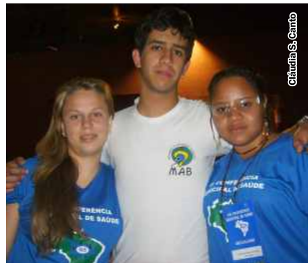
Presidente do Conselho Municipal de Saúde argumenta sobre vaga para jovens no Conselho

Cultura e o Projeto Semente de Adolescentes e Jovens Voluntários.