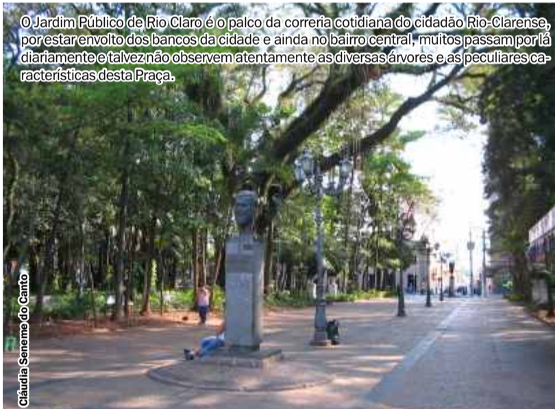
O Jardim Público de Rio Claro é o palco da correria cotidiana do cidadão Rio-Clarense, por estar envolto dos bancos da cidade e ainda no bairro central, muitos passam por lá diariamente e talvez não observem atentamente as diversas árvores e as peculiares características desta Praça.