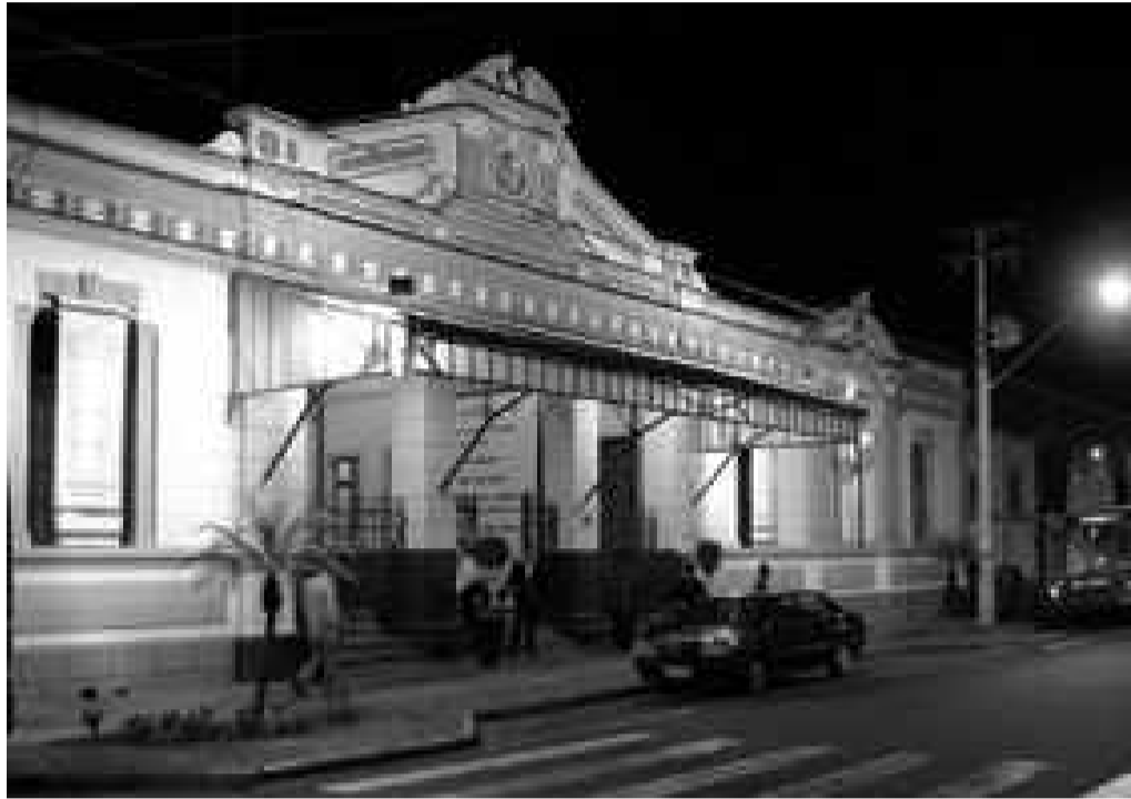
Fachada da antiga Estação Ferroviária

A intenção é iniciar o projeto na volta das férias escolares, já que os alunos da rede de ensino serão determinantes para a escolha das Sete Maravilhas de Rio Claro.