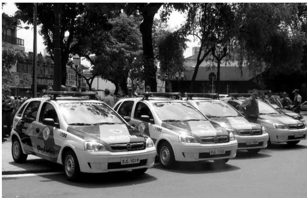
Dezenas de viaturas estavam expostas na Praça José Bonifácio, em Piracicaba