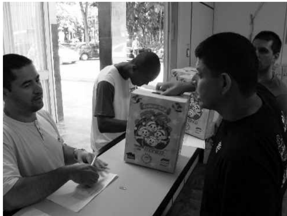
Mais de 4.500 cestas básicas foram distribuídas gratuitamente aos funcionários

O secretário municipal de Agricultura, Abastecimento e Silvicultura de Rio Claro,