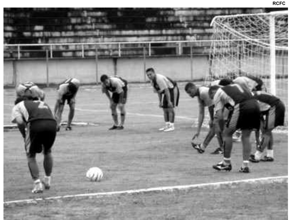
Enquanto o time principal treinava duro em Pouso Alegre, os juniores tentam a classificação para a próxima fase da Copa SP de Futebol Junior

Uma vitória simples do Rio Claro fará a festa da torcida rio-clarista.