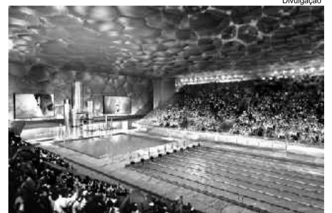
Piscinas olímpicas: esperança brasileira de medalhas

Ao lado uma foto do luxuoso complexo aquático construído para o evento.