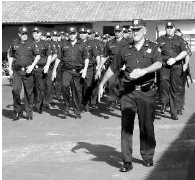
Muito estudo e aulas práticas marcam início de carreira

As atividades acontecem na cidade de Araras, em área da empresa Wilson D. Zorzo ME. De segunda à quinta-feira é ministrada a parte teórica, com orientações que passam pelo uso de algemas e treinamentos para condução de detidos, uso de