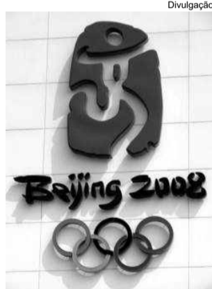
Beijing para os chineses ou Pequim para nós

China prepara maior evento esportivo de todos os tempos com estádios modernos