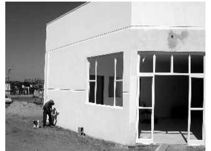
Acabamento finaliza obra no Jd. das Flores

As novas unidades de saúde da família terão consultório odontológico, consultório clínico, salas de vacinação, de enfermagem, de ginecologia e de recepção.