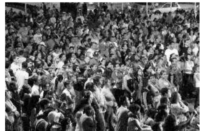
Milhares de pessoas, na maioria jovens, curtiram o evento

Conforme presenciamos, o público foi muito receptivo e estava animado com as músicas e com as palavras de fé proferidas no evento.