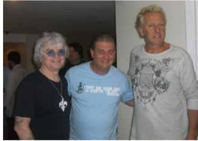
Rio-clarense Fábio Garrito é o produtor de Air Supply no Brasil

maior parte de composição do próprio vocalista e instrumentista, Graham Russell, que em parceria vocal com Russell Hitchcock conseguem transmitir beleza e harmonia em suas canções.