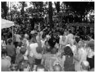
Foliões no Jardim Público

As antigas marchinhas de carnaval, que após várias gerações ainda compõem a identidade musical da Folia de Momo, são o principal destaque do Baile Dourado de Rio Claro, evento gratuito que acontece nos dias dois (sábado), três (domingo) e cinco (terça-feira) de fevereiro, a partir das 16 horas no Jardim Público central do município.