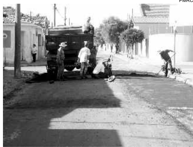
Equipe faz recape na Vila Alemã