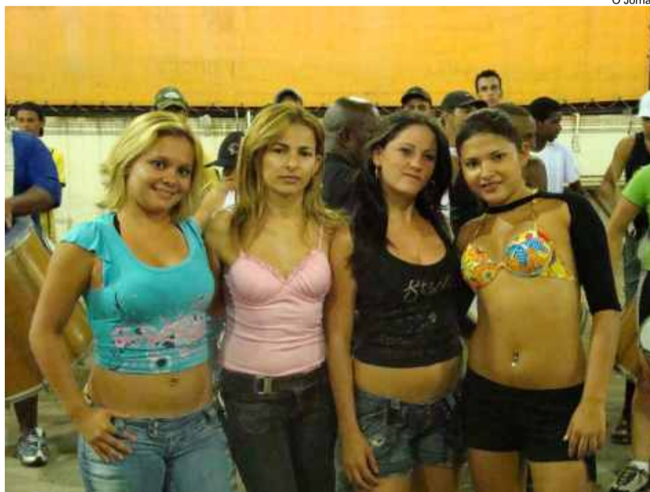
Destques da Escola de Samba "Os Indaiás" que comemoram 35 anos de Carnaval

A maior festa popular do país está prestes a começar e as escolas intensificam os ensaios para entrarem na passarela do samba com muita energia, prontas para abrilhantarem o evento. Não deixe de prestigiar o desfile das escolas de samba. Ingressos a venda na Secretaria de Turismo, na antiga Estação Ferroviária.