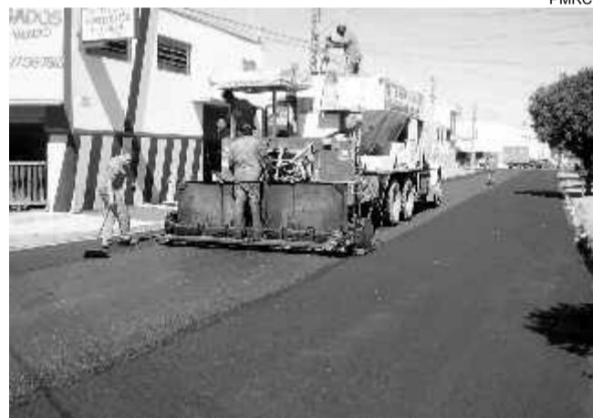
Equipes de trabalho em várias regiões da cidade