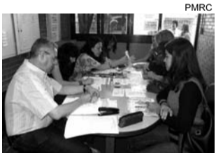
Eventuais se inscrevem

A Secretaria Municipal da Educação de Rio Claro encerra na próxima terça-feira, dia 29, as inscrições para os profissionais interessados em reger classe ou ministrar aula, em caráter temporário e emergencial, nas escolas da rede municipal de ensino durante este ano. Quem não fizer a inscrição não poderá ter classe em 2008.