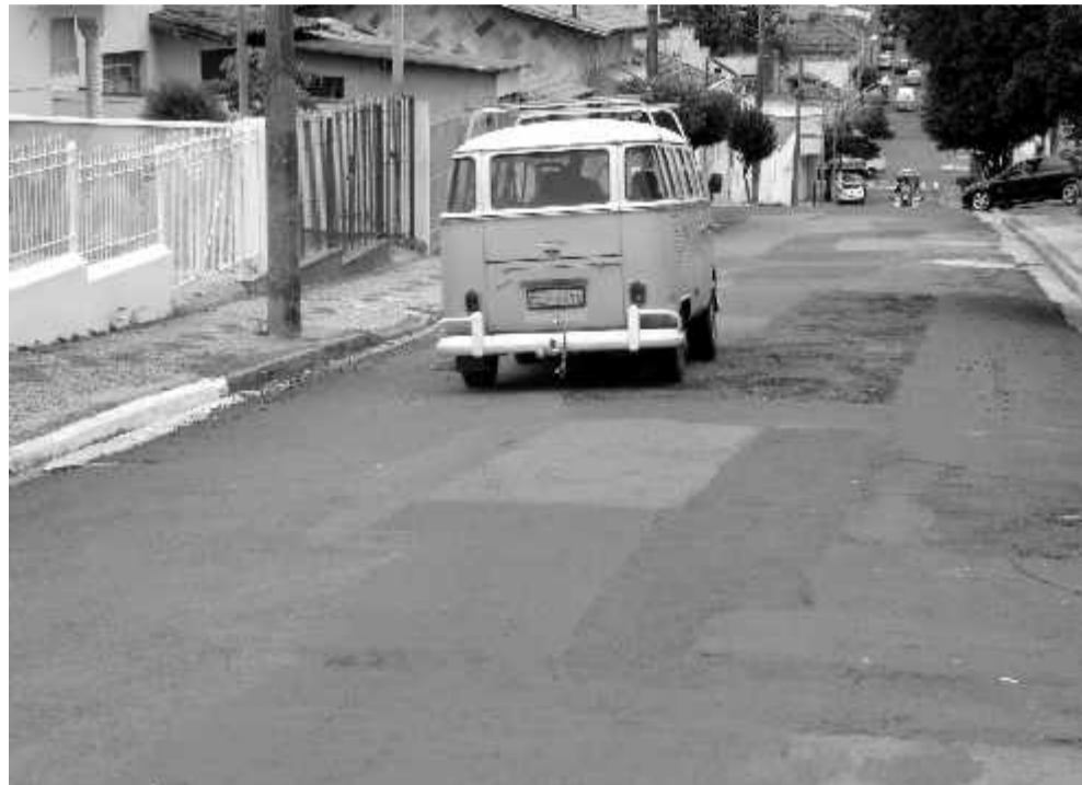
Veículos, ao longo do tempo, se deterioram devido às más condições das ruas

go, revejam essas prioridades e possam atender às ruas mais danificadas.