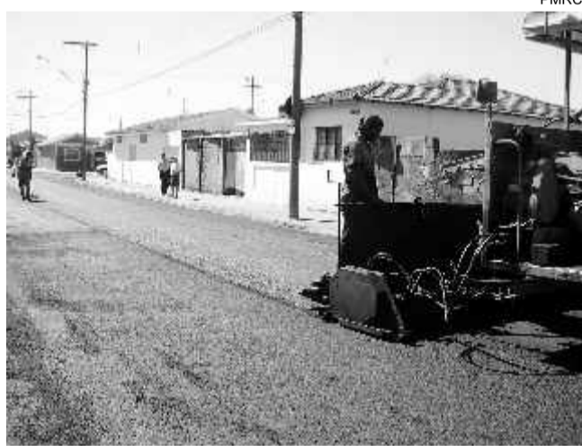
Jardim Olinda recebe pavimentação