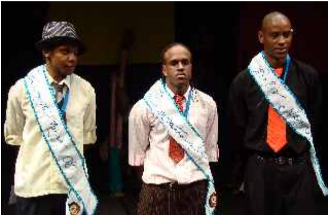
Diamante negro, simpatina negro e mais belo negro 2008