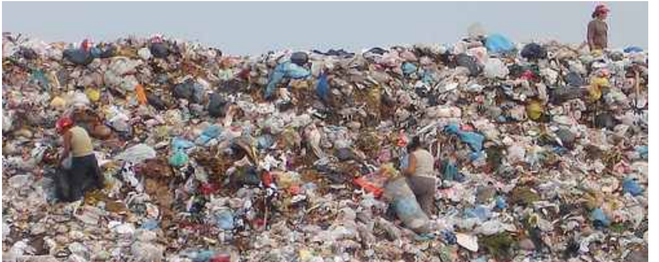
Aterro Sanitário com predominância da cor branca, das sacolas plásticas, nocivas ao meio ambiente

Ao final da apresentação da campanha foi rea-