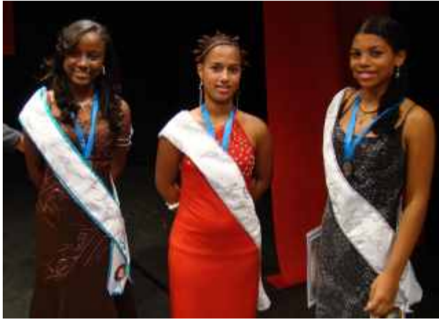
Mais bela negra, pérola negra e simpatia negra 2008